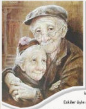
Eskiler öyle miydi?

Eskiler diyorum... Anıların imrendiğimiz, yerinde olmak için tüm hayali gücümüzü seferber ettiğimiz, kalpleri temiz, dostlukları baki, sözleri değerli eskiler.